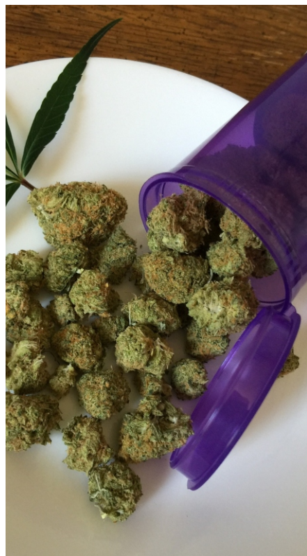
Das «Geschäftsmodell» ist gescheitert: Das grüne Gold ist mittlerweile verglüht.