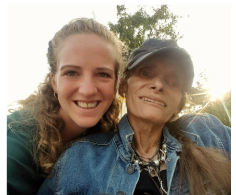
Ein jahrelanger Drogenkonsum zerstört Körper, Geist und Seele.

Deshalb muss die Studie insbesondere die Kosten der abstinenzorientierten Therapien und deren soziale Folgekosten mit den Substitutionen und ihren Folgekosten verglichen werden. Denn Nachhaltigkeit wäre auch in der Drogenpolitik gefragt. Vorzeitige Pflegeheimenritze von Betäubungsmittelkonsumenten, die nie zu einem Drogenausstieg motiviert wurden, die ihr Leben lang am staatlich finanzierten Herointropf hängen oder andere Ersatzdrogen erhalten, verursachen hohe Pflegekosten.