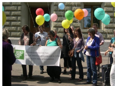
Am «Internationalen Tag gegen Drogenmissbrauch und illegalen Drogenhandel» weisen wir auf politische Missstände hin.

Es kann doch nicht sein, dass ehrenamtlich Tätige in Vereinigungen wie «Eltern gegen Drogen» in ihrer Freizeit mit Demos gegen Fixerräume, mit selbst finanzierten Broschüren zu Drogenfragen an Info-Ständen wie zum Beispiel am 26. Juni am «Internationalen Tag gegen Drogenhandel und Drogenmissbrauch» und mit Protesten wegen den illegalen Machenschaften an der jährlich stattfindenden Cannatrade die eigentlichen Aufgaben des Bundesamtes für Gesundheit mit seinen hochbezahlten Angestellten übernehmen müssen!