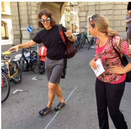
Standaktion mit Cannabis- und Alkoholbrillen, um die Wahrnehmungsveränderungen nach dem Konsum dieser Suchtmittel erleben zu können.

Wann nehmen der Bundesrat, das Bundesamt für Gesundheit, die Parteien (insbesondere die FDP) und die Medien die Meinung der Mehrheit der Bevölkerung zur Legalisierung von Cannabis und anderen Drogen zur Kenntnis? Warum haben die Medien die SDA-Meldung vom 16.7.2021 nicht übernommen, wonach bei einer Umfrage 62% die Legalisierung von Cannabis ablehnen?