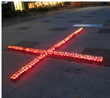
Wir trauern um die Menschen, welche wegen unserer «Laissez-faire-Drogenpolitik» sterben mussten.

Darum unsere Forderung: Das bestehende Ungleichgewicht der Massnahmen und der Finanzierung der vier Säulen Prävention, Therapie, Schadensminderung und Repression muss behoben werden. Die daraus resultierenden Folgekosten des illegalen Drogenkonsums müssen transparent kommuniziert werden. Die viel gepriesene Vier-Säulen-Politik muss einer Kosten-Nutzen-Analyse unterzogen werden. Nur eine nachhaltige Drogenpolitik ist zielführend. Es geht nicht nur um die hohen Kosten, die uns eine kleine Anzahl von Konsumenten von