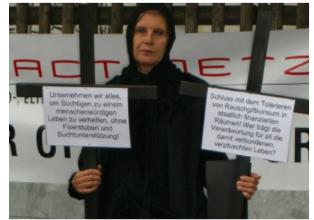
Trauer und Wut über die «Offenen Drogenszenen» und die danach geforderten Fixerräume veranlassten «Eltern gegen Drogen» zu einem Protest-Marsch.