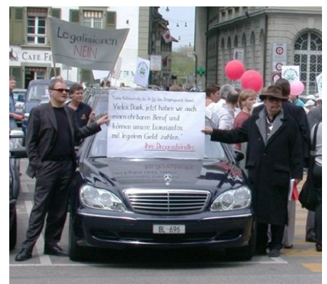
Protestaktion auf dem Bundesplatz: Eine repressive Drogenpolitik hat in der Schweiz nie stattgefunden. So ist unser Land ein begehrtes «Pflaster» für Drogendealer, wo sie jahrelang ihre Geschäfte auf Kosten süchtiger Menschen abwickeln können.